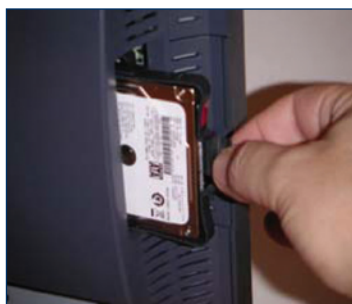
RAID Hot Swap